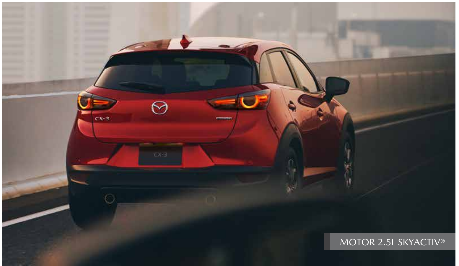
MOTOR 2.5L SKYACTIV®