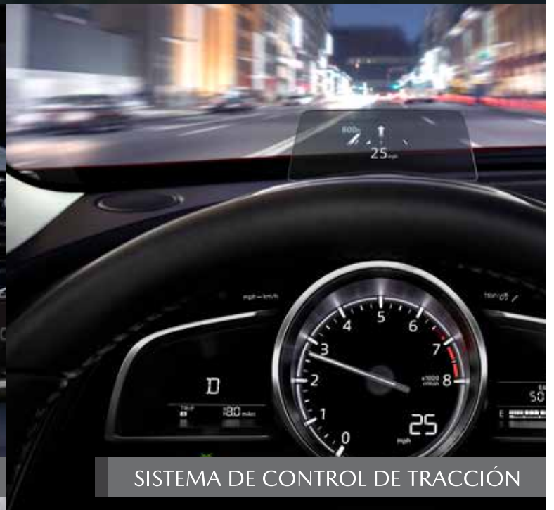
SISTEMA DE CONTROL DE TRACCIÓN