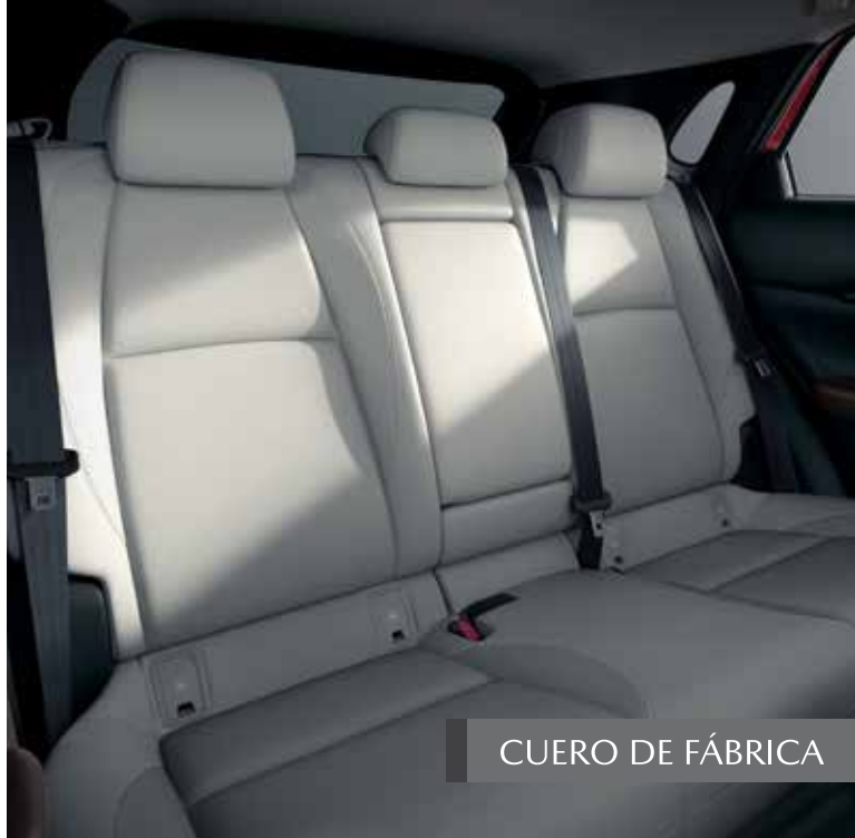
CUERO DE FÁBRICA