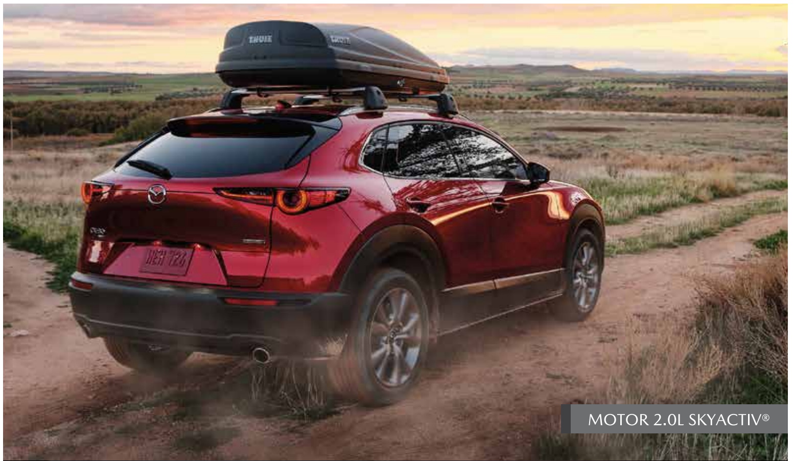
MOTOR 2.0L SKYACTIV®