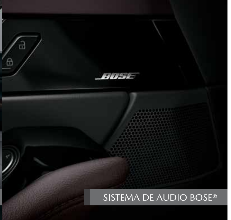
SISTEMA DE AUDIO BOSE®