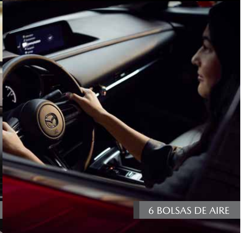
6 BOLSAS DE AIRE