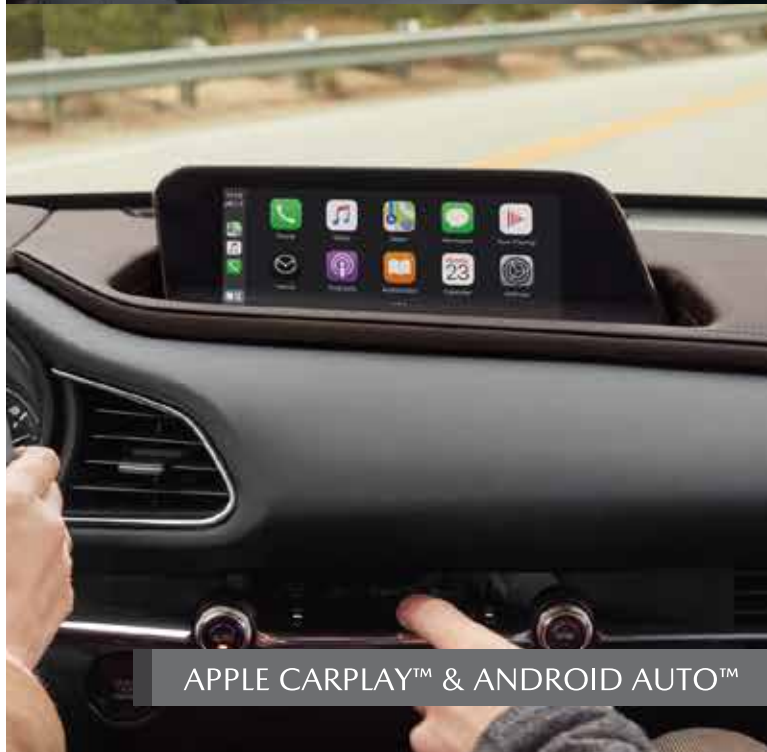
APPLE CARPLAY™ & ANDROID AUTO™